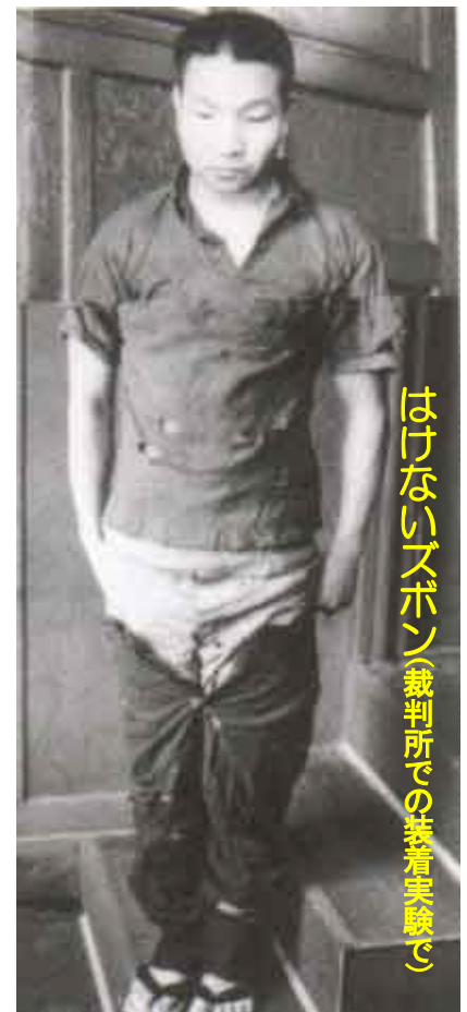
はけないズボン(裁判所での装着実験で)

検察官が、ズボンのサイズを表す記号だとした記号は、色を表す記号だと言うことや、鮮やかな緑色をした5点の衣類発見当時のカラー写真など、検察官が多くの証拠を隠していたことも、この間明らかになりました。